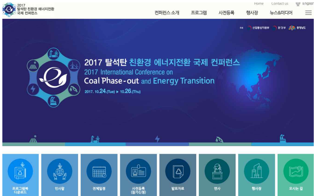
〈그림 1〉 국제컨퍼런스 인터넷 홈페이지 ( http://www.iccpet.co.kr )