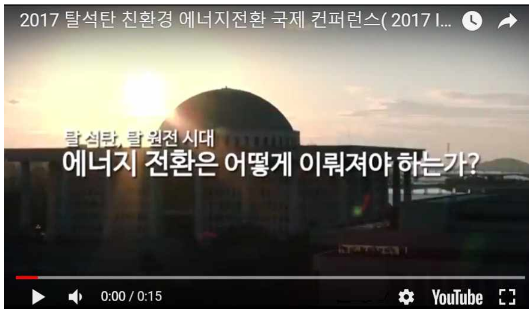
〈그림 2〉 국제컨퍼런스 홍보 영상