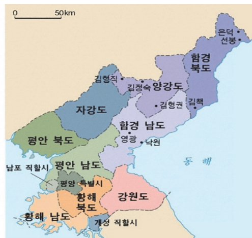
(우) 현 북한 행정구획