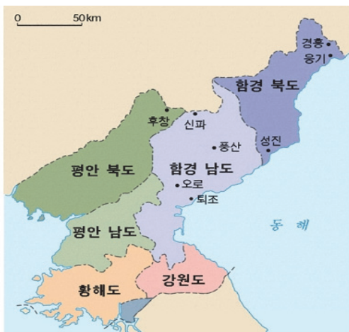
(좌) 분단 전 행정구획