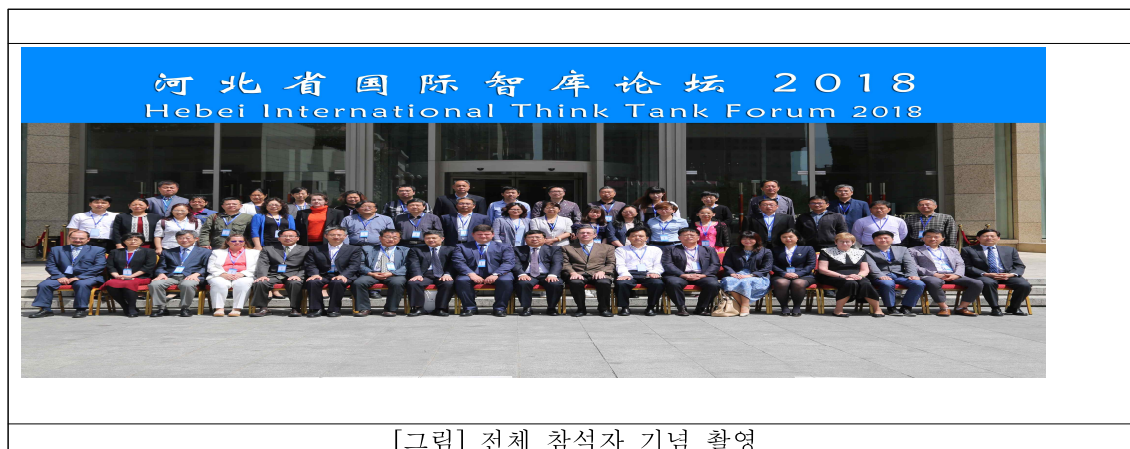
[그림] 전체 참석자 기념 촬영