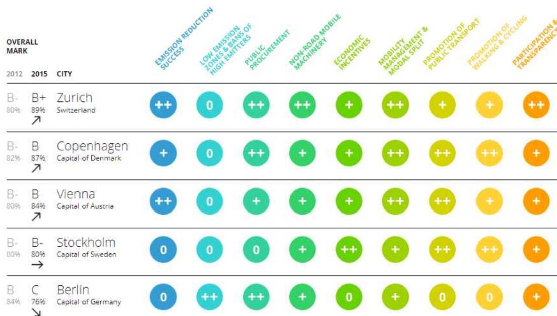
<그림 2> 유럽 도시 랭킹 상위 5위 도시

( http://www.sootfreecities.eu/sootfreecities.eu/public/city )