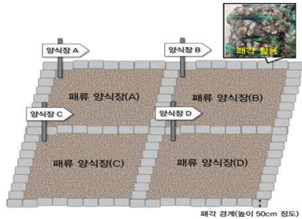
[그림 2] 패류 양식장 전경 8) , 공동체 정원(갯벌농장) 개념도(우)