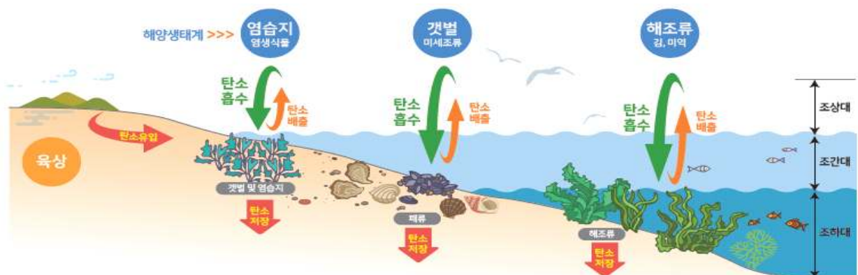
[그림 4] 블루카본의 온실가스(CO2) 흡수·저장 개념도 9)