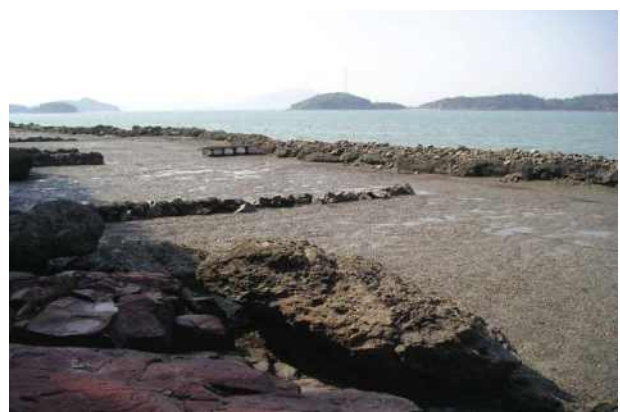
[그림 1] 갯벌 양식장 사례. 전남 고흥군 남성리(좌), 고흥군 백일도(우)