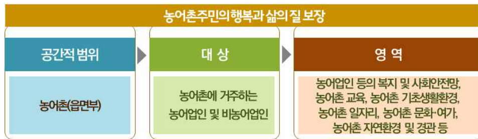
[그림 1] 농어촌 복지의 정의