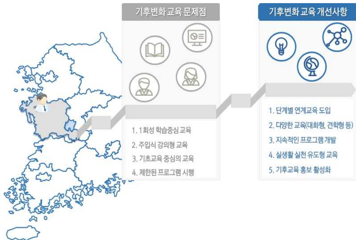
[문제점 및 개선사항]