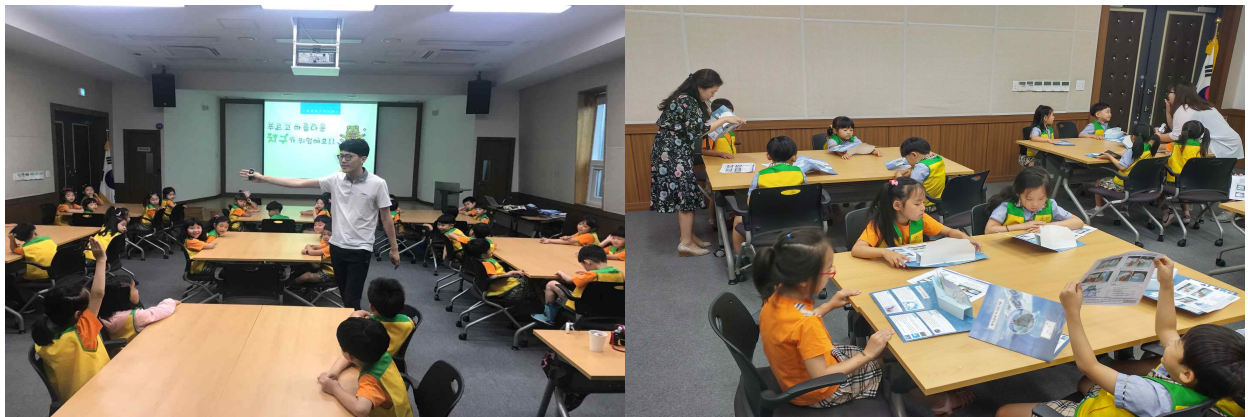
[내 포 폴 꽃 향기유치원 교육사진]

5) 선택적 학습(교육교구 실습) : 북극곰 팝업북 만들기를 통한 지구온난화 이해