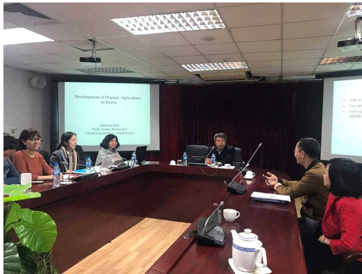
<사진 1> 워크숍 전경