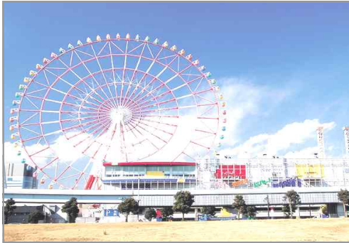
2010년 평양에 새롭게 문을 연 개선 청년공원: 금강하탕(자이로드롬), 배그네(바이킹), 관성비행차(롤러코스터) 같은 최신 시설의 놀이기구가 있음