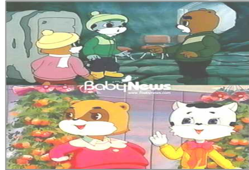
북한 어린이들이 즐겨보는 애니메이션 ‘영리한 너구리’

베이비뉴스( http://www.ibabynews.com ) 2015. 01. 31 베이비뉴스( http://www.ibabynews.com ) 2015.01. 31