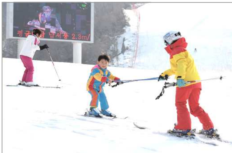
마식령 스키장에서 스키타는 북한어린이

비록 남한과 북한은 분단되어 있지만, 다름의 역사는 같음의 역사보다 매우 짧은 것을 기억해야 합니다(김진선, 2003). 앞에서 살펴보았듯이 1946년까지도 남북한이 모두 어린이날을 사용하고 기념했음을 잊지 말아야 합니다. 남북한은 오랜 기간 동안 동일한 문화를 공유해 왔고, 민속놀이 등의 역사성을 가진 우리만의 문화를 발전시켜왔습니다(최민수, 신현미, 2012). 북한의 국제아동절이나 남한의 어린이날에 남북한 어린이들이 하는 놀이 활동들-울동과 악기 연주, 짝지어 달리기, 공차며 달리기, 밧줄당기기, 바람개비 돌리기, 줄넘기, 씨름 등-은 유사한 모습을 보이고 있습니다. 그리고 삶을 바탕으로 하는 생활 속에서 어린이를 귀하게 여기는 마음은 하나일 것입니다. 최근 북한 관련 자료들(2018 북한이해; 베이비뉴스 2015. 01. 31)에 의하면, 북한에도 놀이공원이 있고, 북한 어린이들이 즐겨보는 애니메이션 등도 접할 수 있습니다. 일부이긴 하지만 스키를 타는 어린이 사진이 공개되기도 했습니다. 북한 사회에서 이와 같은 문화를 모든 어린이들이 진정 자유롭게 향유할 수 있기를 기대하며 발표를 마치겠습니다.