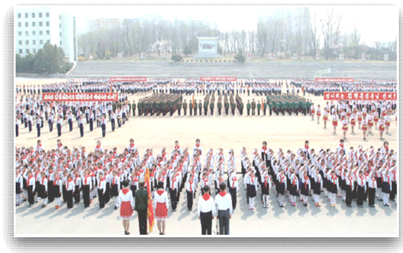
소년단 입단식 모습(2018 북한이해, p. 181)