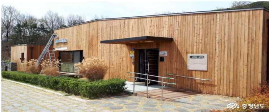
주·야 24시간 보육... '옛 도지사 관사를 아이들 공간으로'