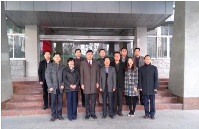
[ 학술 연구 교류협력네트워크를 구축 업무 협약 ]