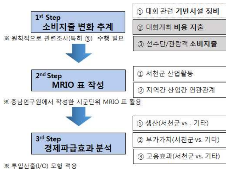
(그림 2) 체육대회 개최의 경제적 효과 분석 과정