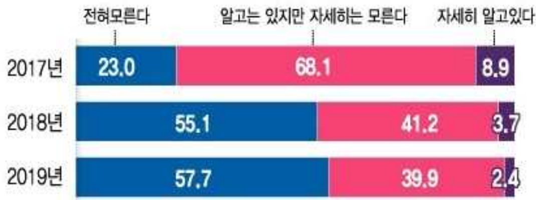
창업지원정책에 대해 알고 있습니까? (단위: %)