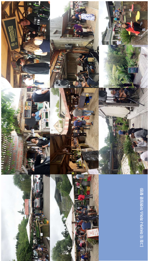
[그림 5] 마타카나 파머스 마켓(왼쪽 촬영)

시장매니저는 예전 시장에서 시도되었던 ‘쓰레기 제로’ 정신을 다시 추진하고 있었고, ‘쓰레기 제로 이벤트’와 음식물 쓰레기 처리 방안을 시도하여 시장 내 쓰레기의 90%를 감축시켰다. 마타카나에서 쓰레기 처리를 위해 250km 떨어진 Tuakau 시설을 이용해야 하지만 비용과 시간 문제가 수반되기에 쓰레기 제로를 위한 방안을 고심하고 있었다. 지방의회가 쓰레기 처리와 관련된 사회 기반 시설을 제공하지 않았기에 시장 매니저는 이를 위해 레드 비치 비즈니스와 퇴비사와 연계하여 쓰레기를 처리하고 있었다. 현재 시장에는 쓰레기 줄이기 기금 15,000달러의 자금이 투입되고 있고, 또한 쓰레기 제로 영화를 제작하여 상영하고 있으며, 주차장에서 보여주는 교육용 쓰레기 쇼 프로그램, 재활용 쓰레기통 설치 등을 제시하고 있었다.