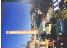
[그림 11] 초기 빅토리아파크 마켓 모습 (빅토리아파크 입구 전시 사진 방문 촬영)