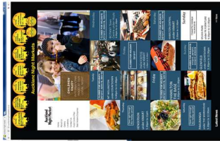
[그림 8] 나이트마켓 홈페이지

주요 품목은 다양한 이민자들에 의한 티문화 음식이고, 신선한 채소 및 과일, 향신감, 의류, 수공예품, 음악과 공연을 볼 수 있는 활동적인 공간으로 자리매김 하고 있다. 오를랜드는 밤 문화가 조성되어 있지 않고 일반 상가 및 음식점의 경우 일찍 문을 닫기 때문에 쇼핑물과 연 계된 공간에서 열리는 나이트마켓의 경우 많은 사람들이 방문한다. 음식 매대의 경우 우리나라와 비슷하게 매대 허가 규칙이 까다로우면서 높은 수익을 높일 수 있고, 공예품 및 일반 판 매 매대는 하가는 쉬우나 수익률이 높지 않다. 어린이들이 운영하는 매대도 있다.