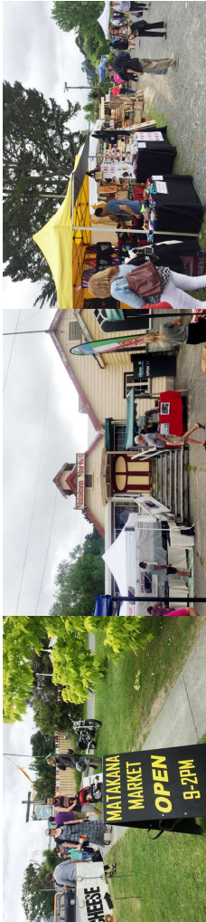
[그림 7] 마타카나 마켓 모습(왼쪽 촬영)