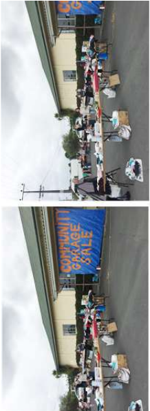
그림 4) 마타카나 마을에서 토요일마다 community garage sale