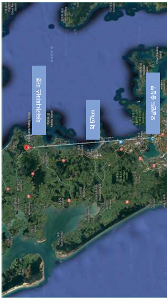
그림 3) 마타카나 파머스 마켓 위치도(구글지도)

파머스 마켓 주변으로 마타카나 마켓이 매주 토요일 오후 1시~14시에 공예품 중심으로 열리며, 마을에서 다양한 커뮤니티 제라지 세일(communitary garage sale)이 토요일에 열린다. 이 때문에 평일에는 조용하다가 토요일에 많은 관광객이 몰려 북적거리는 마을로 변모한다.