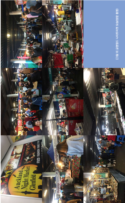
[다림 이 글렌필드 나이트마켓 모습(영문 촬영)]