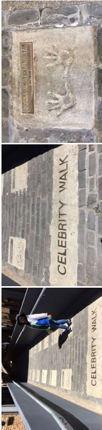
[다림 101 건물 2층 연결통로의 핸드페인팅 거리(영문 촬영)]

오클랜드 시의회는 복합 단지를 철거 할 계획이었지만 공개적인 캠페인을 통해 시장 및 소매 단지로 개조되었으며, 1983년과 1990년에 현재의 목적으로 변경되었다. 1984년 Victoria Park Market Ltd가 단지를 구입하여 2010년 이 복합단지는 소매 상가로 재개발 되었다. 1983년부터 상가로 운영된 빅토리아 파크 마켓은 현재 역사적인 건물이 밀집되어 있는 지역에 40개가 넘는 상점, 카페 및 레스토랑으로 구성되어 있다.