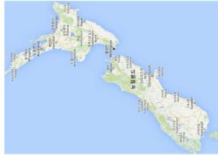
[그림 1] 뉴질랜드 지도