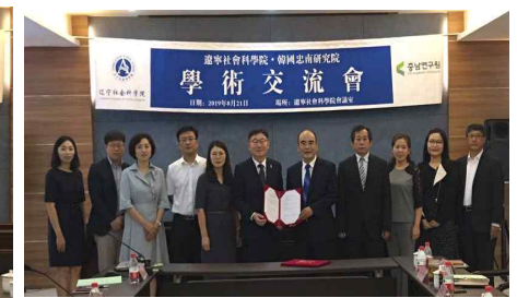
<그림 3> 충남연구원-랴오닝사회과학원 학술세미나