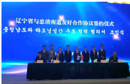
<그림 2> 충남연구원-랴오닝사회과학원의 MOU 체결식