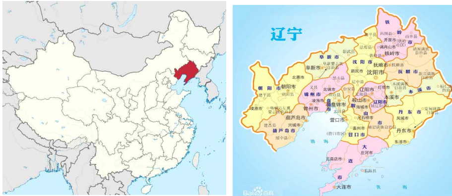
<그림 1> 랴오닝성 지도