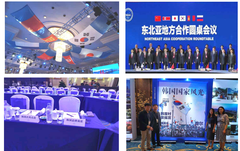
<그림 5> 동북아 지방정부 합작 원탁회의