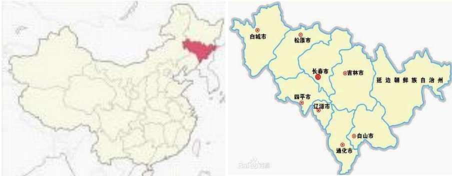
<그림 4> 지린성 지도