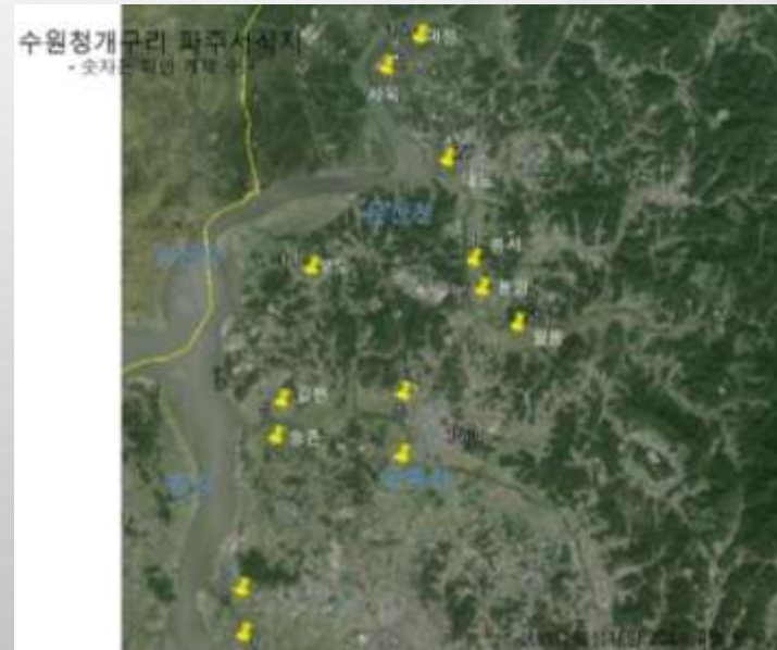
2012 민통선 정자리 수원청개구리발견