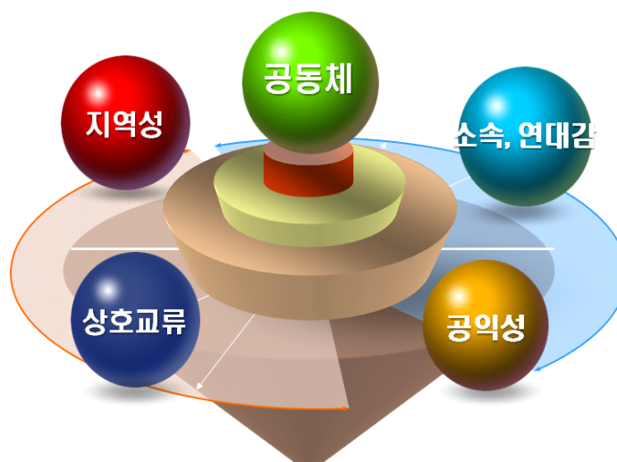
공동체의 개념적 요인