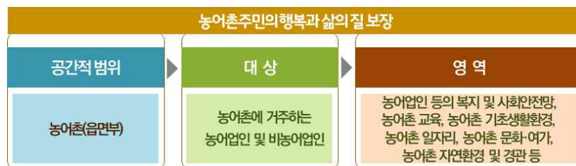
[그림 1] 농촌 복지의 정의