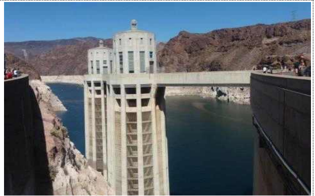
취수탑 및 발전실