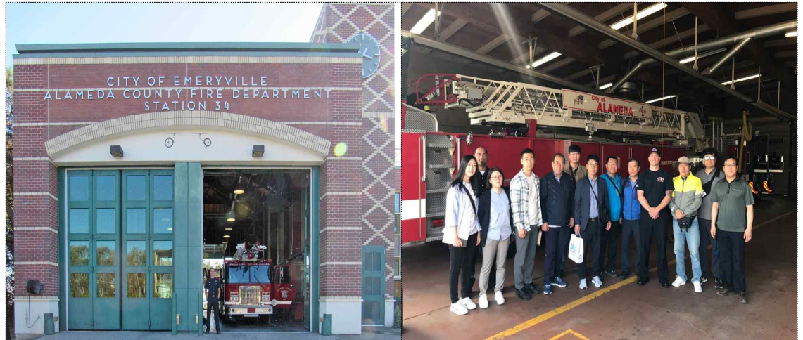
알라메다 소방서 사진