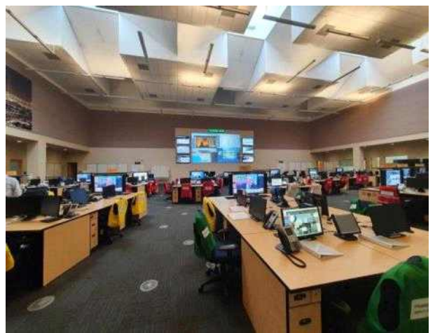
LA 위기관리센터 종합상황실