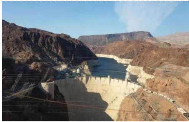
후버 댐(Hoover Dam) 전경