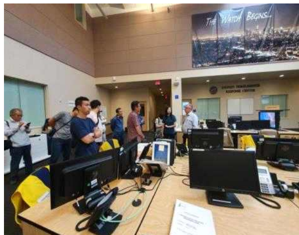
부센터장의 설명 / 질의응답