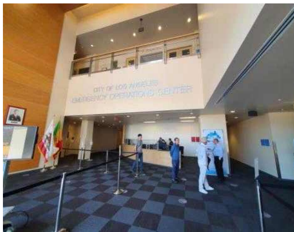
LA 위기관리센터 1층 현관