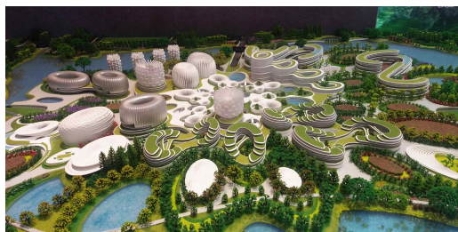
천부신구 미래 조감도