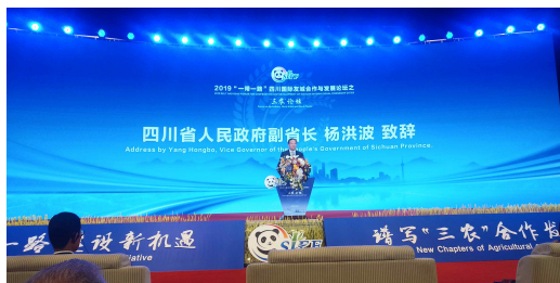
사천성정부 양홍보 부성장 축하