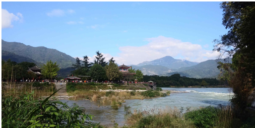
도강언의 북쪽 전경