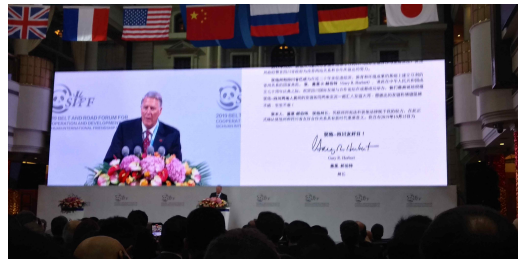
미국 유타주 부주지사 축하