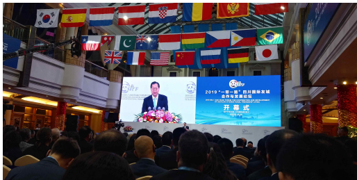
펑청화(彭清华) 사천성 주석 축하