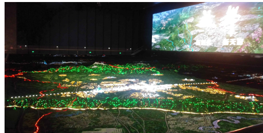
성도시의 전체 조감도(조형물)