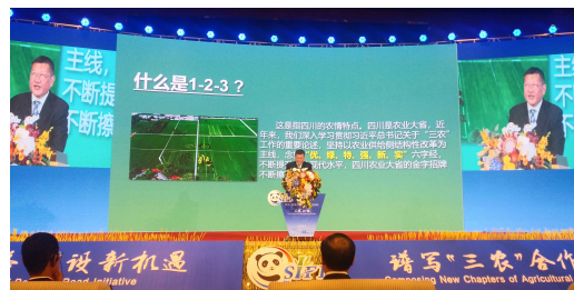
사천성 농업농촌청장 발표