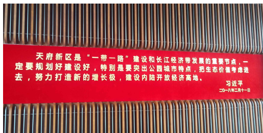
천부(天府)신구 시진핑 주석 방문 기념 어록 표지판