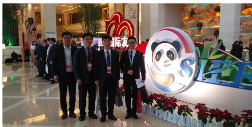
[그림 2] 사천성 국제우호도시 성장(省長)·주장(州長) 포럼