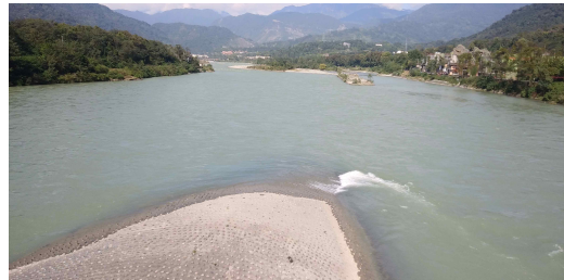
도강언의 새부리모양의 톱