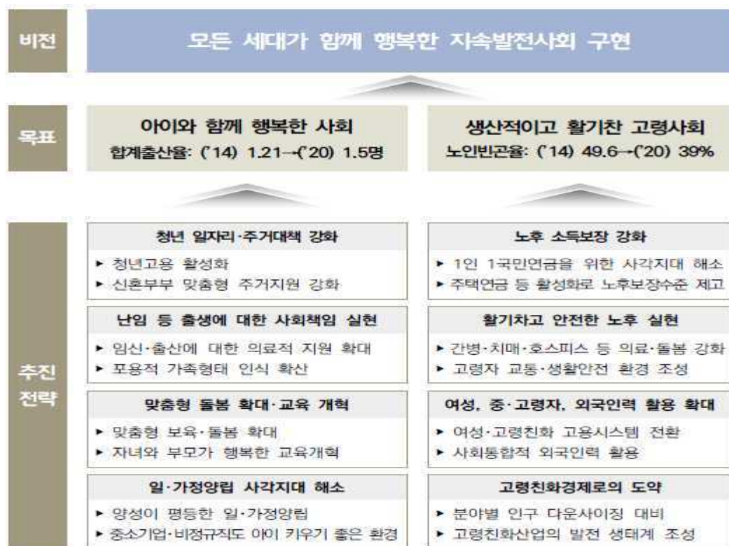
[그림 1] 저출산·고령화 기본사회 계획 체계도