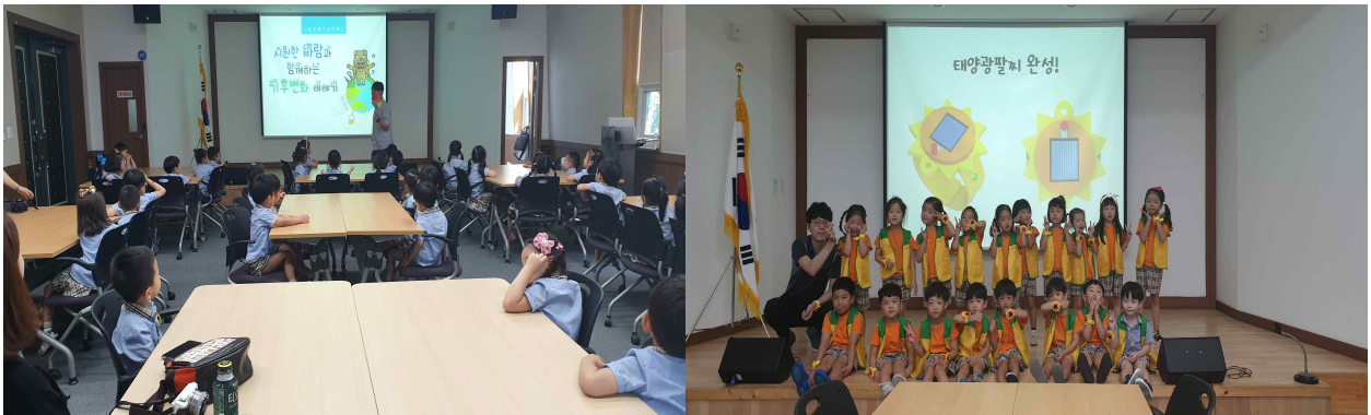
[ 원아 교육사진 ]