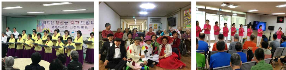
[그림 3] 아산시 노인종합복지관 내 시니어 봉사활동

자원봉사참여노인은 요양원 방문시 환자들의 상태악화가 있을 경우 마음이 무겁다. 자원봉사참여노인은 대상자와의 라포관계 형성이 어렵다. 이를 위해서는 봉사자의 자존심(에고)를 버려야 한다. 봉사참여노인은 열심히 최선을 다해 자원봉사를 하는 사람도 있지만 형식적으로 봉사활동 하는 사람도 있다.