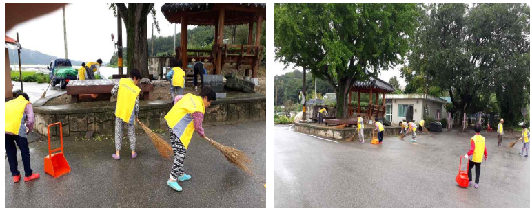
〔그림 4〕 대한노인회 부여지회 노인자원봉사클럽 봉사활동

노인자원봉사 우수사례에 대한 시상에서는 영예의 최우수상으로 선정된 제주연합회 제주상록헬스케어나눔단 등 17개 노인자원봉사클럽이 보건복지부장관상을 수상하였고 서울연합회 금천구지회 무지개클럽 등 16개 노인자원봉사클럽이 대한노인회 회장상을 각각 수상했다. 노인자원봉사클럽의 실무자들은 참여노인을 상대로 초기교육과 보수교육을 실시하지만 노인을 상대로 한 교육이 쉽지 않은 것도 애로사항의 하나다.