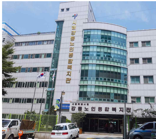
〔그림 1〕 강동노인종합복지관

강동구 시니어 봉사단 노인자원봉사 수요처는 지역사회 내 노인자원봉사활동에 대한 욕구가 있어, 정기 또는 비정기적인 봉사대 파견을 복지관에 신청한 기관 중 이동거리, 봉사활동 수행 환경, 봉사 대상자의 특성 등을 고려하여 WECAN시니어봉사단 리더가 선정한다.