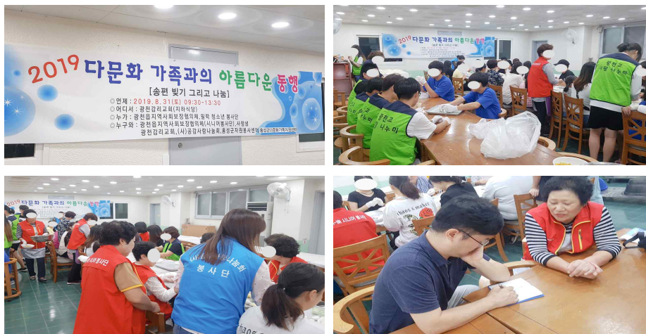
〔그림 2〕 필락시니어봉사단 봉사활동

사단 활성화의 문제가 남아있다. 봉사단 활성화를 위해서는 광천읍은 공간적 면적이 넓으므로 기동력이 있는 봉사단원이 필요하나 참여노인들이 연령이 높으므로 기동력이 있는 단원을 찾기 힘들다. 또한 봉사단 활동시 하는 사람만 하고 하지 않는 사람은 하지 않는다. 부녀회, 마을 복지사 등 기존조직과 필락시니어봉사단 단원이 중복 되는 문제도 발생한다. 필락시니어봉사단의 회장 총무 등 리더들은 소명의식 필요하나 이전에 봉사활동의 경험이 없는 분들은 제 역할을 못 하는 경우도 있다. 필락시니어봉사단 단원들의 공통적인 애로사항은 대상자와의 라포(관계형성)형성의 어려움이다.