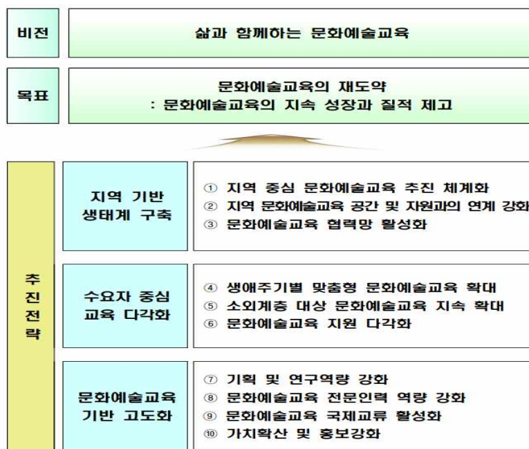
〈그림 1〉 문화예술교육종합계획(2018~2022) 비전과 전략

자료 : 문화체육관광부, 2018. 문화예술교육 종합계획(2018~2022).