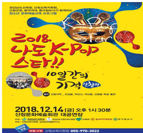
〈그림 8〉 나도 K-POP 스타! 10일 간의 기적