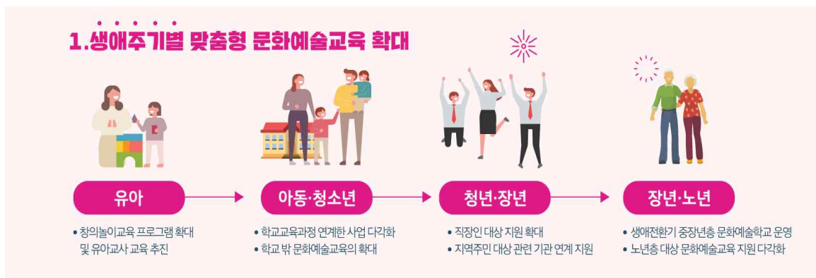
〈그림 2〉 생애주기별 맞춤형 문화예술교육 확대