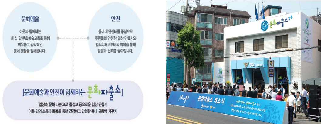
〈그림 10〉 문화파출소 추진배경 및 문화파출소 강북 개소식