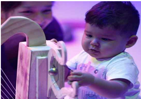
〈그림 5〉 호기심을 자극하는 아트그라운드 프로그램