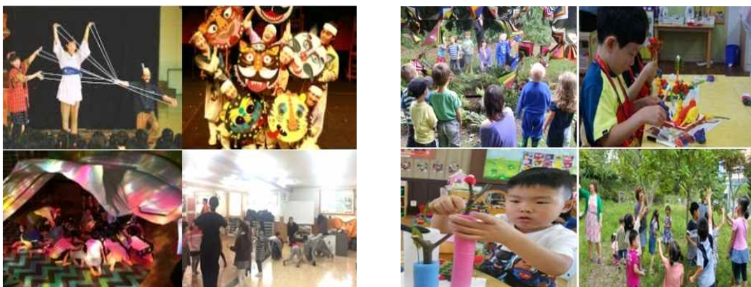
〈그림 7〉 '2017 유아 문화예술교육 학술회의' 발표 사례