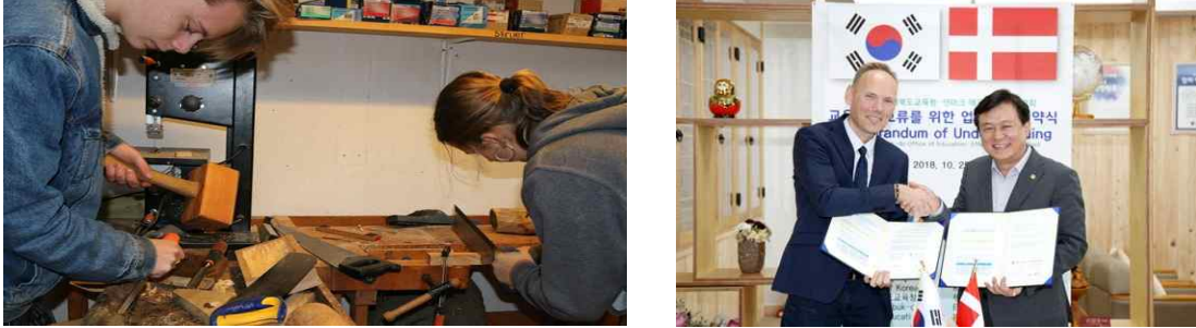
〈그림 9〉 덴마크 에프터 스콜레의 교육과정 및 충북교육청 교사 교류 협약