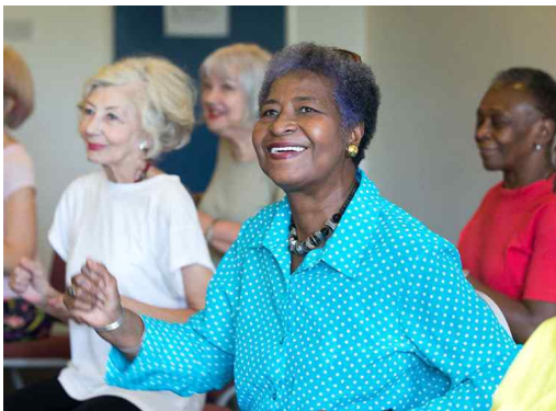
〈그림 12〉 영국 U3A 문화예술교육 프로그램