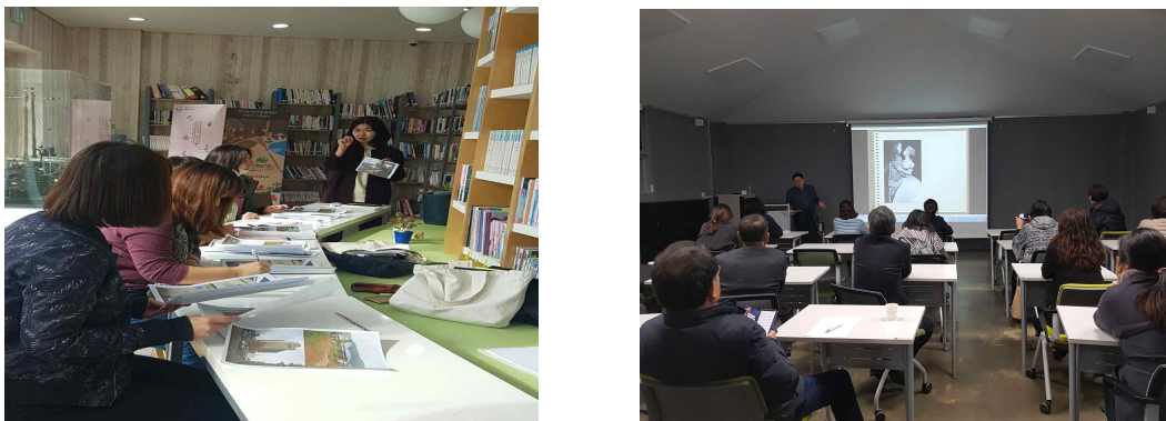
〈그림 11〉 아산문화재단의 장년 대상 문화예술교육 프로그램