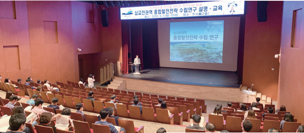
지난 6월 예산군에서 개최된 삽교천권역 종합발전전략 설명회 모습

충남연구원은 가로림만권, 천수만권, 금강권 및 삽교천권 등 유역을 중심으로 관련 연구를 진행하고 있다. 이들 지역은 산과 산림자원, 바다와 수산자원, 강과 역사문화자원 및 농경지 등 식량자원을 함께 공유하고 있어, 충남도와 시군이 연계하고 협력하여 공유자원을 보전