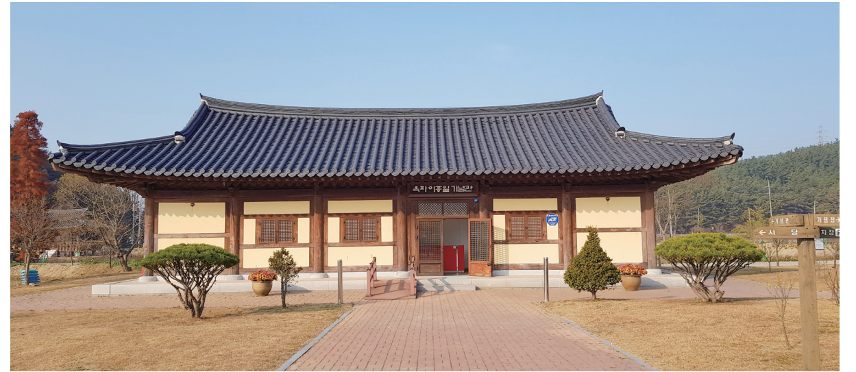
▲ 이종일 기념관 전경

이종일은 초기에 실학사상의 심취와 탐구에서 개화사상으로 나아간 뒤 다시 동학사상을 받아들여 서 지행합일을 이루게 되는데, 이는 독립운동이나 여성해방운동이 동학사상과 일치하고 있음을 강조하는 것으로 나타나고 있다.