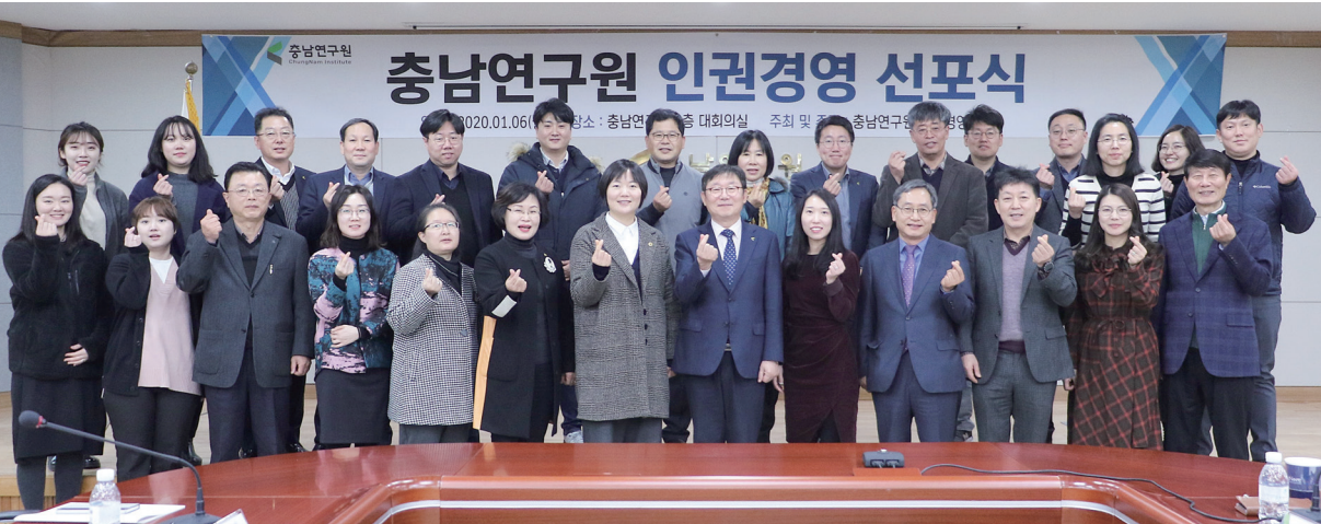
충남연구원 인권경영 선포식

전국 시도연구원 가운데 최초로 UNGC에 가입하였다. UNGC(United Nations Global Compact)는 2000년 7월에 뉴욕 UN 본부에서 인권, 노동, 환경, 반부패 분야의 원칙들을 준수하고, 지속가능발전목표(SDGs) 등 세계 최대의 기업 시민 이니셔티브이다. UNGC가 강조하는 4대 분야 및 SDGs 등의 국내·외 인적교류를 갖고 충청남도 싱크탱크로서 충남연구원의 역량을 더욱 강화해 나가며 UN 등 국제사회가 제시하는 지속가능성 및 기업의 사회적 책임을 충청남도 지역 정책과 발전에 체계적으로 내재화할 것을 약속했다.