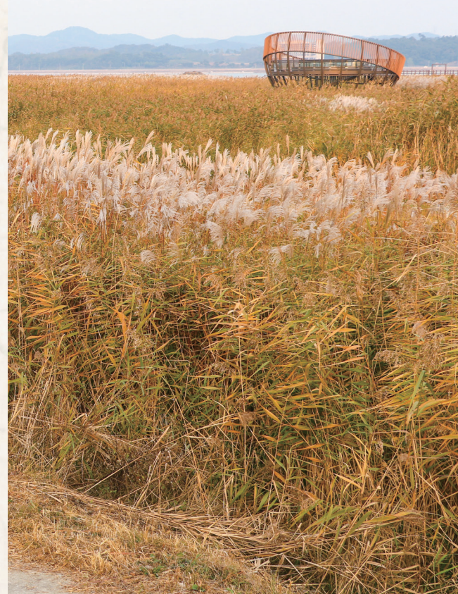
▲ 신성리 갈대밭 - 임윤환

이번에는 아산시의 공세리 성당과 공주시의 갑사 주변, 그리고 서천군의 신성리 갈대밭의 가을 풍경을 담아 보았다.