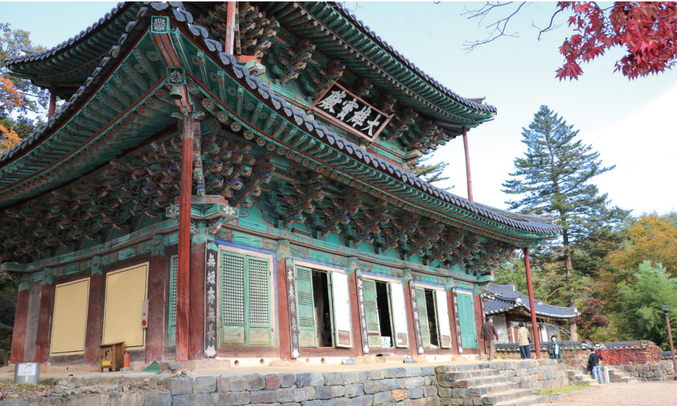
▼ 마곡사 대웅보전의 모습

대광보전은 마곡사의 주불을 모시고 있는데, 17세기 중반에 건립된 것으로 추정하고 있다. 3단의 자연선 기단 위에 정면 5칸, 측면 3칸의 다포계 팔작지붕의 건축물이다. 대광보전의 편액은 강세황의 글씨로 알려져 있다. 대광보전에는 [수월백의 관음보살도]가 있는데, 보타락가산 위에 흰 사라와 백의를 입은 관음보살에게 선재 동자가 합장을 하고 있는 모습을 그린 것이다. 바로 [수월백의 관음보살도]로 인해 마곡사는 한국의 33관음 성지 중의 하나이며, 내국인을 포함하여 일본인도 관음도량 성지순례를 위해 많이 찾아오고 있다. 대광보전 앞에는 오층 석탑이 자리하고 있는데, 특이하게도 상륜부에 청동제의 금동보탑이 올려져 있는 것으로 보아 원나라 말기 라마불교의 영향을 받은 고려시대 석탑으로 알려져 있다. 이러한 양식의 탑은 한국, 인도, 중국에 3개 밖에 없는 귀중한 것이다.