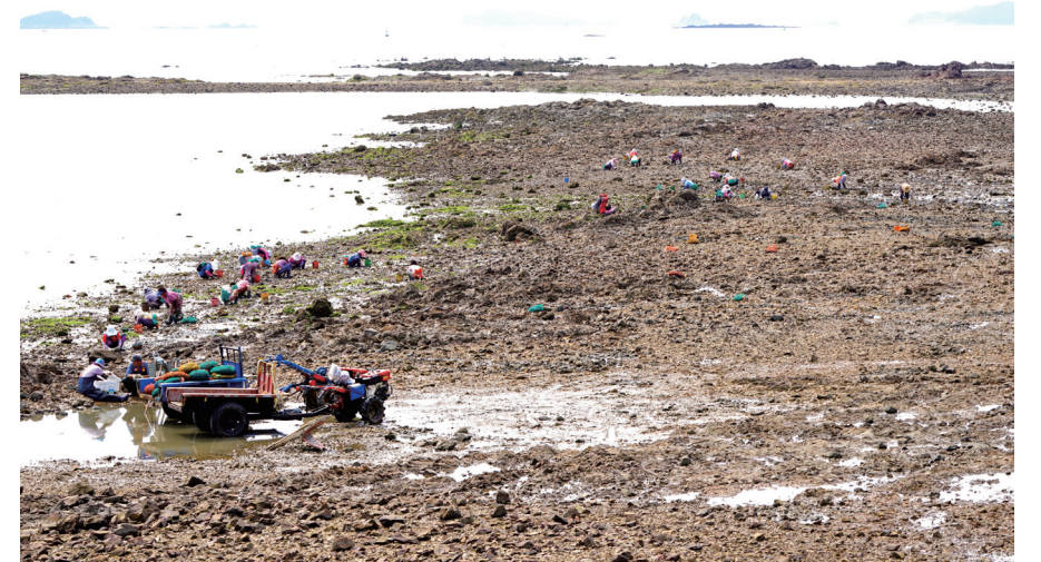
▲ 바지락 채취 중인 장고도 주민들