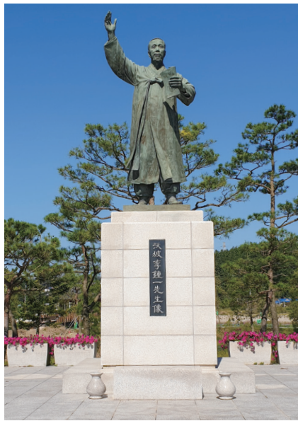
▲ 이종일 동상