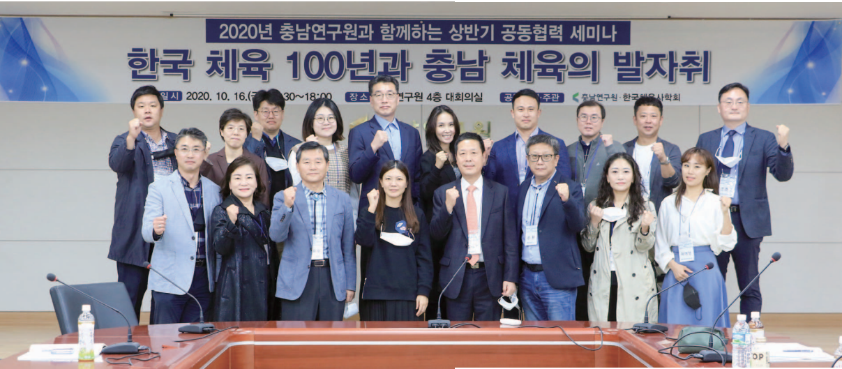
지난 10월 충남연구원에서 개최된 한국체육사학회의와 공동협력 세미나 모습

충남의 포용적 관점의 문화정책 및 사업은 추진 주체에 따라 중앙정부 주도형(통합문화이용권, 무지개다리사업 등), 충청남도 주도형(찾아가는 어린이 뮤지컬, 장애인 지원 사업), 충남문화재단 사업을 통한 추진형(장애인 문화예술교육배달사업, 학교 밖 문화예술교육지원 사업, 찾아가는 공연 “樂樂” 등) 등 세 가지로 구분하여 각기 다른 방식으로 대응하고 있다. 또한 충남도민의 건강수명 증진을 위해 스포츠복지정책 운영 방안에 관한 연구를 진행하고 있다.