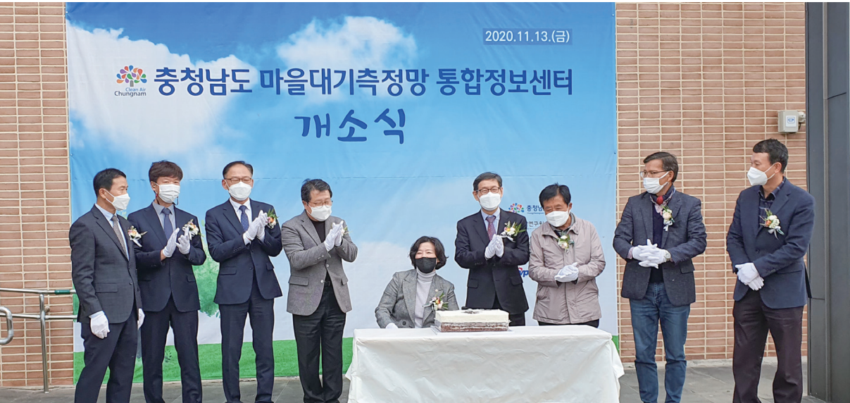
충남 마을대기촉정망 통합정보센터 개소식 - 서해안 기후환경연구소

먼저 민선 7기 도 정책지원 시스템 구축과 관련해서는 충청남도의 정책과 부합하도록 연구소 및 센터의 정책개발과 연구방향을 모색하고 있으며, 센터의 특성에 따라 정책 연구 및 정책 지원 역량 강화를 위한 시스템 구축을 위해 노력하고 있다. 다음으로 정책 연구 및 정책 지원 성과의 도민 환류 시스템 강화를 위해서는 센터의 현황 및 기능, 성과 등을 적극 홍보할 수 있는 시스템을 구축하기 위해 노력 중이며, 센터의 성과를 공유하기 위한 워크숍이나 세미나, 토론회 등을 개최하고 있다. 마지막으로 충남도의 조례에 근거하여 각 센터가 설치된 만큼 연구원 규정과 규칙 등과의 조화로운 협력을 위해 노력하고 있으며, 각 센터별 독립성과 연계성을 강화하기 위한 방안을 모색하고 있다.