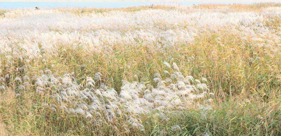
◀ 활짝 개화한 신성리 갈대- 임윤환