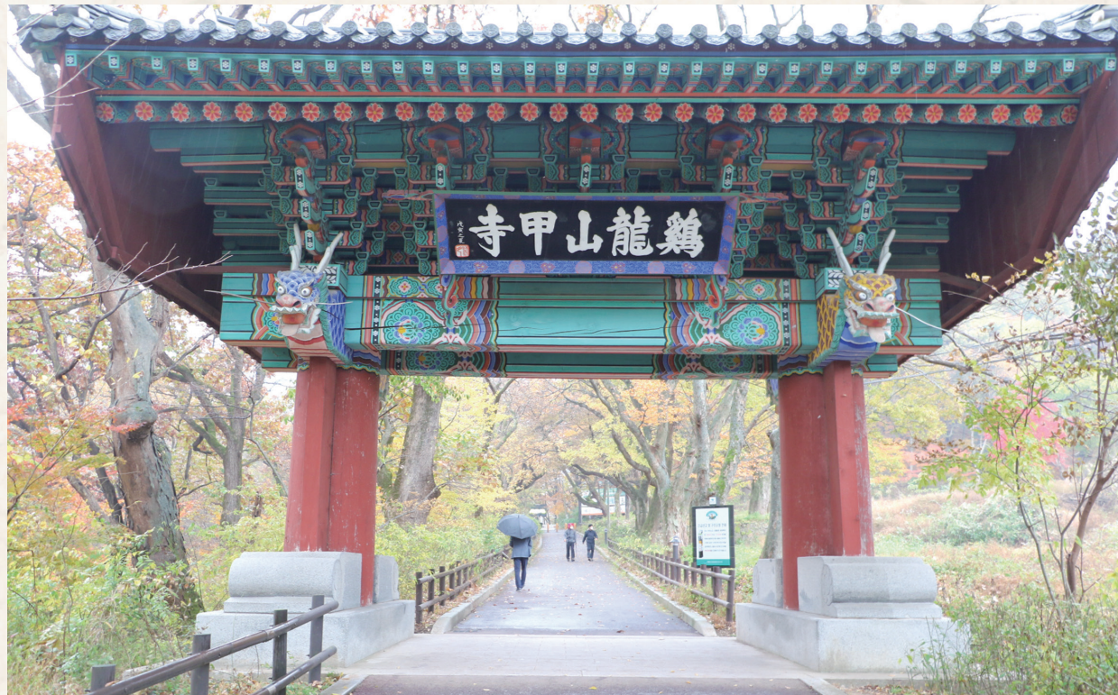
갑사 일주문 - 임윤환 ▶