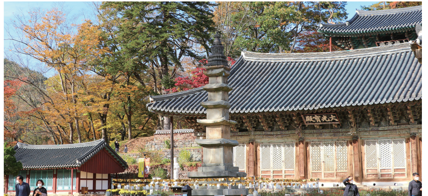
▼ 마곡사 대광보전과 오층 석탑