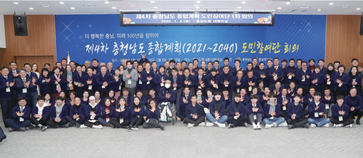
도 종합계획 도민참여단 회의

민선 7기 이후 탈석탄 에너지전환을 공론화하고 제도화하는데 초점을 맞추어 연구를 진행하고 있다. 2019년에는 보령화력 1, 2호기를 2020년 말까지 폐쇄해야 하는 근거를 경제성, 환경성, 전력수급 측면에서 제시하였고, 나머지 석탄화력발전소의 경우에도 기후위기 대응 을 위해서는 단계적으로 폐쇄해야 한다는 정책적 타당성과 정책 개선 방안을 제시하였다. 올해에는 석탄화력발전소 폐쇄 과정에서 지역 사회의 피해를 최소화하고 새로운 지역발전의 기회를 창출하는 정의로운 전환 접근방안을 연구하고 있다.