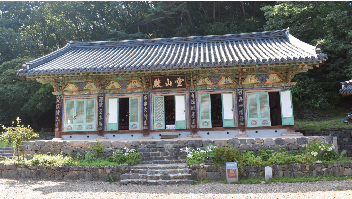
▲ 마곡사 영산전 전경

글 | 김창수 | 충남연구원 홍보팀