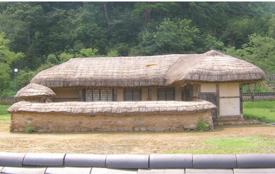
▲ 이종일 생가