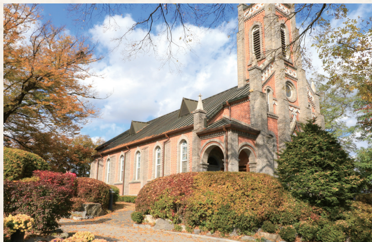
아산시 공세리 성당 - 이유나 ▶