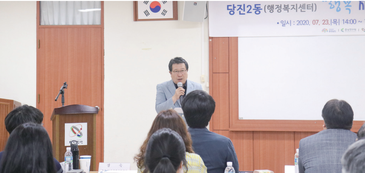
도시재생지원센터 세미나 현장