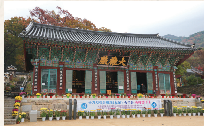
▲ 갑사 대웅전 전경 - 임윤환