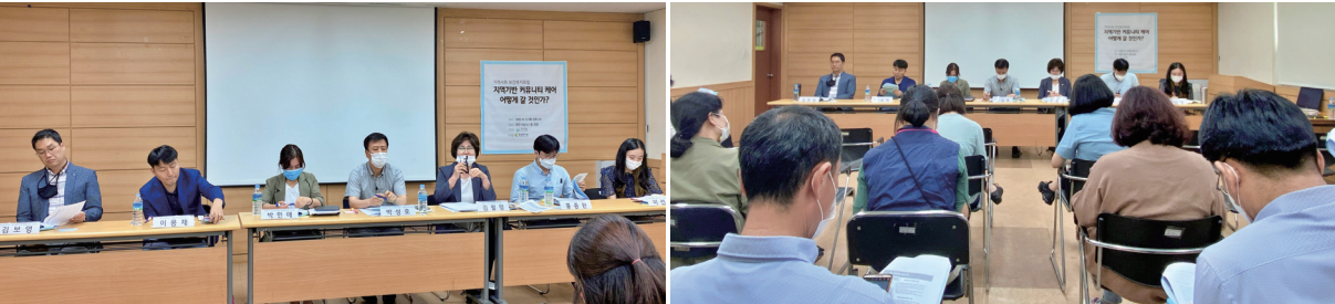
▼ 지역사회 보건복지포럼 사진

천안시가 노인형으로 선도사업을 진행하고 있지만 본 포럼의 참석자들의 활동 영역은 노인 외에도 이주민, 장애인, 사회적경제 등으로 다양하여 다른 영역에서도 지역사회 통합돌봄에 대한 관심이 높음을 확인할 수 있었다.