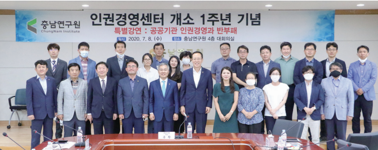
인권경영센터 개소 1주년 기념 행사

인권경영센터는 국내외 기관교류 등을 통해 전문적인 인권역량 강화를 하고 있다. 현재 외국인 노동자나 탈북자, 고령층 인권 등 다양한 인권문제가 쌓여 있는데 이 같은 모델을 충남 각 기관으로, 민간으로 확산되기 위한 민간기관 인권경영 제도화 지원을 하고 있다.