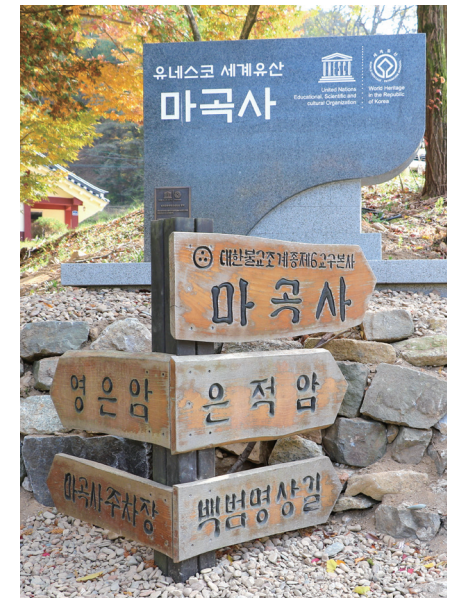
▲ 마곡사 이정표

절 이름과 관련해서는 세 가지 유래가 전해지고 있다. 먼저 마곡사가 위치한 곳이 ‘삼골’이었다는 데서 기인한 것이라고 한다. 다음으로 신라시대 보철 화장이 설법을 할 당시에 모인 사람들이 마치 삼발의 삼대와 같은 형상에서 유래했다고 한다. 마지막으로 성주산문의 개창자인 무연선사가 중국 남종선의 ‘마곡 보철선산’의 법을 이어와 마곡사라 불렀다고 한다.