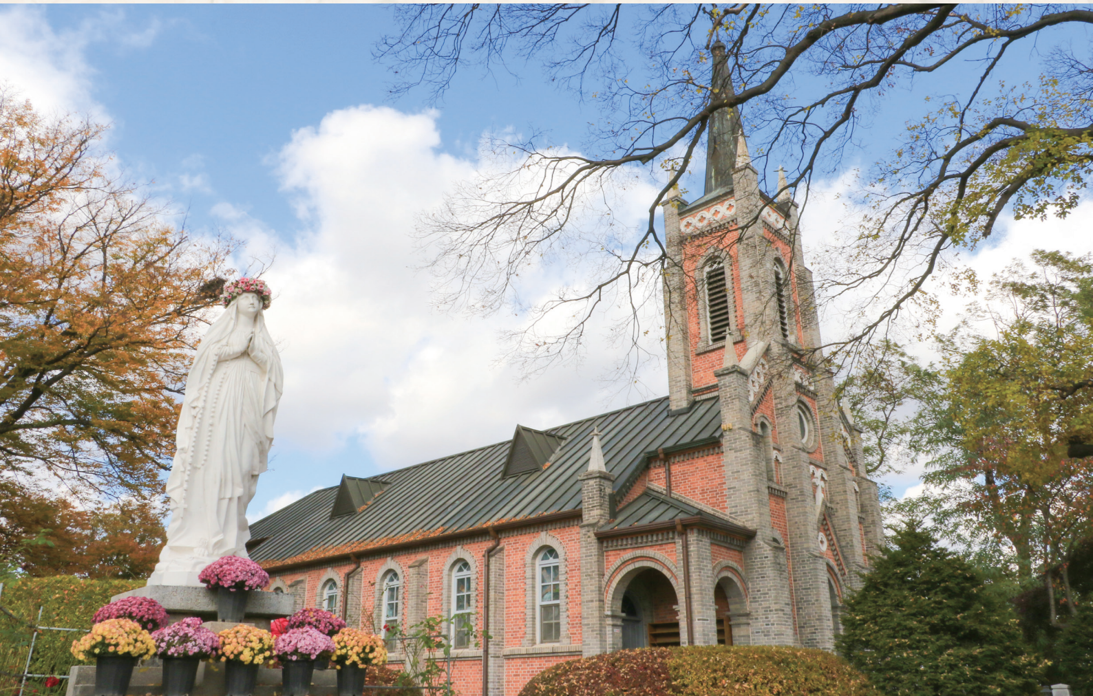
▲ 아산시 공세리 성당과 화관을 쓴 성모상 - 이유나