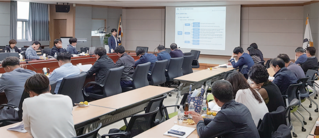
교통복지 관련 공무원 교육 세미나