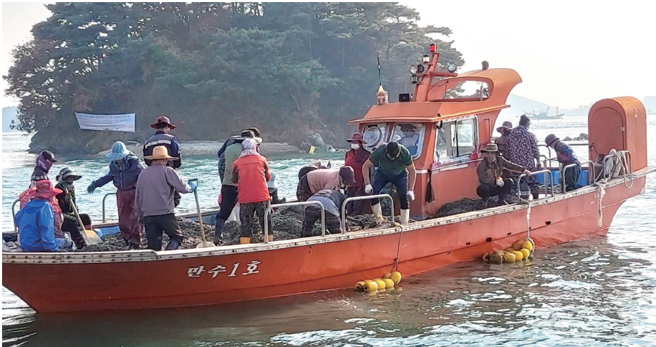
▲ 선상 작업 중인 만수동 주민들