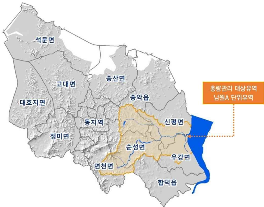
[그림 1] 당진시 삼교호수계 시행계획 대상 단위유역도