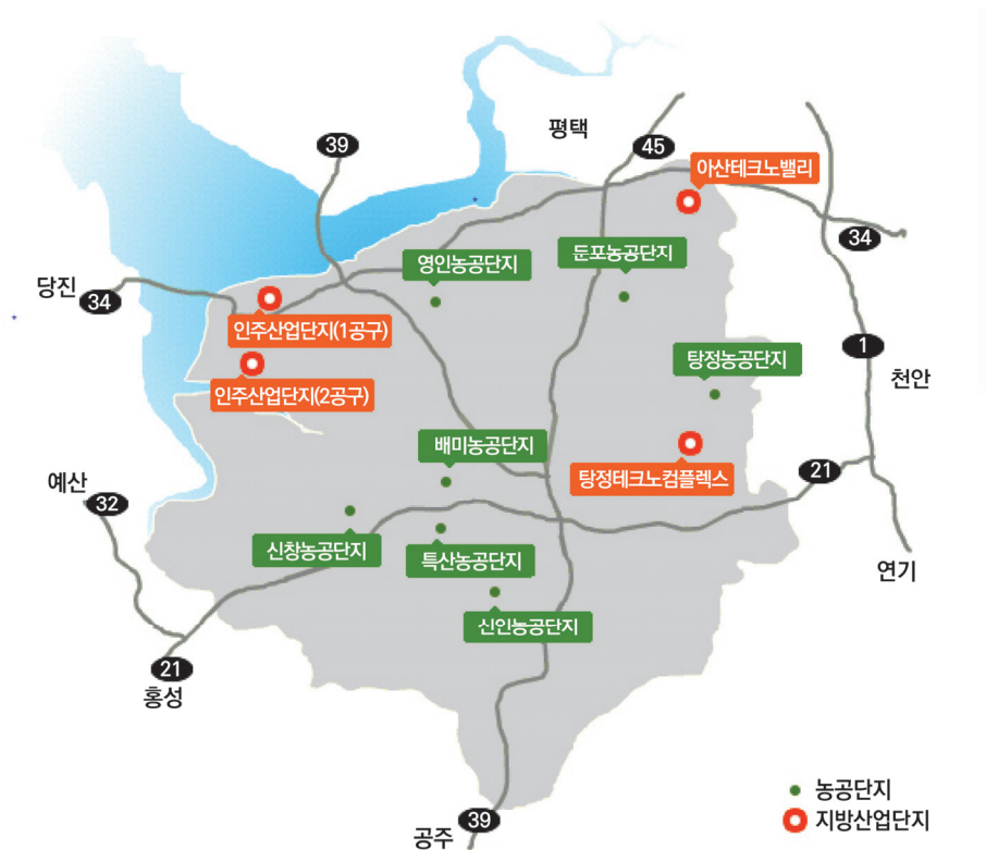
[그림 2] 아산시 산업단지