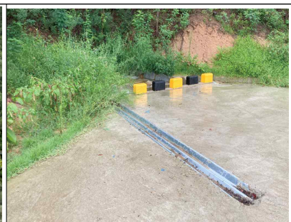
레일형 개거 (시공모습)