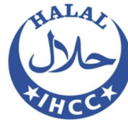
대한민국 IHCC (주)국제할랄인증 지원센터