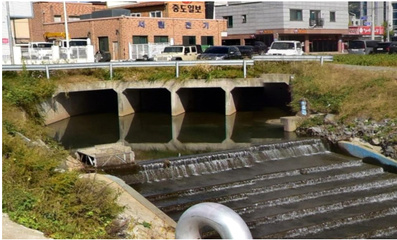
[그림 4] 태안천 정비 현황