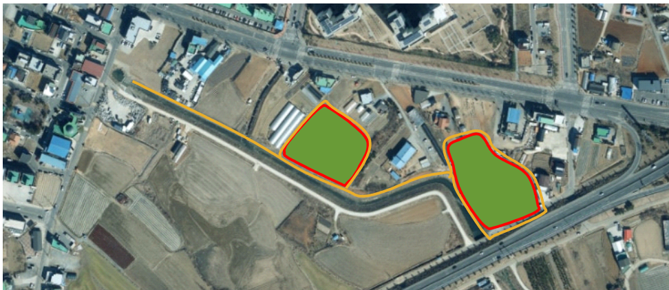
[그림 7] 대안 1 생태공원 조성