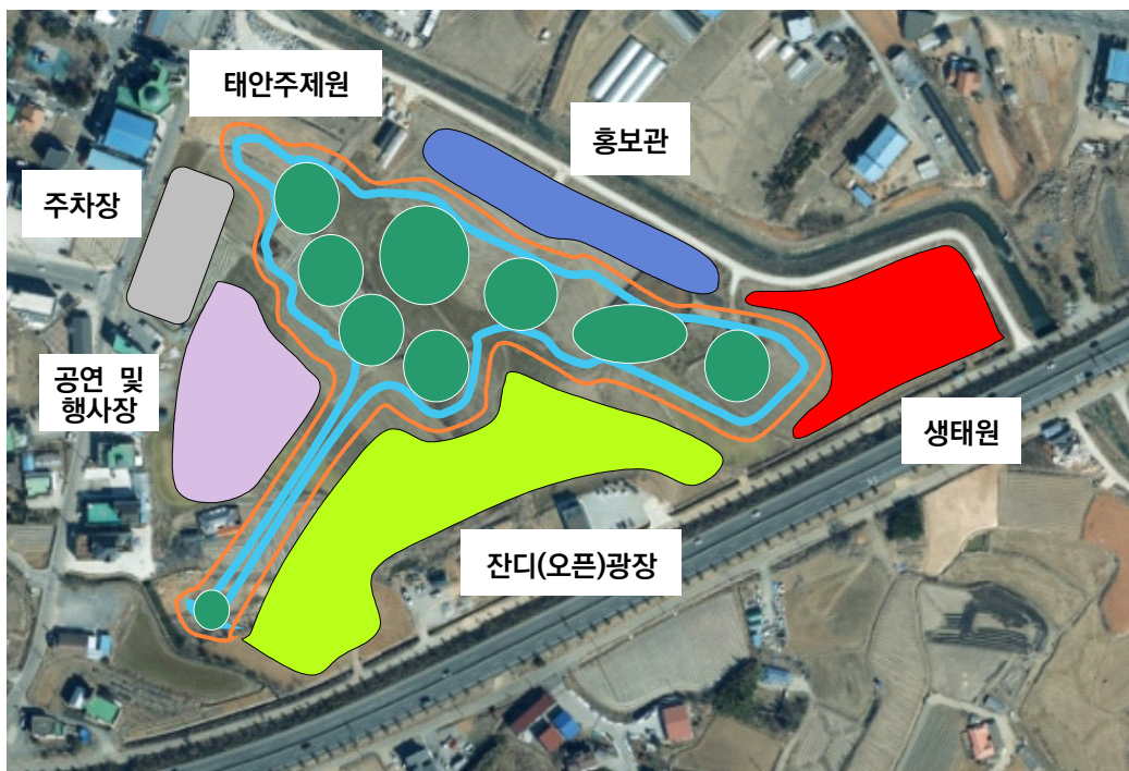
[그림 9] 태안 3 태안 관광 테마공원