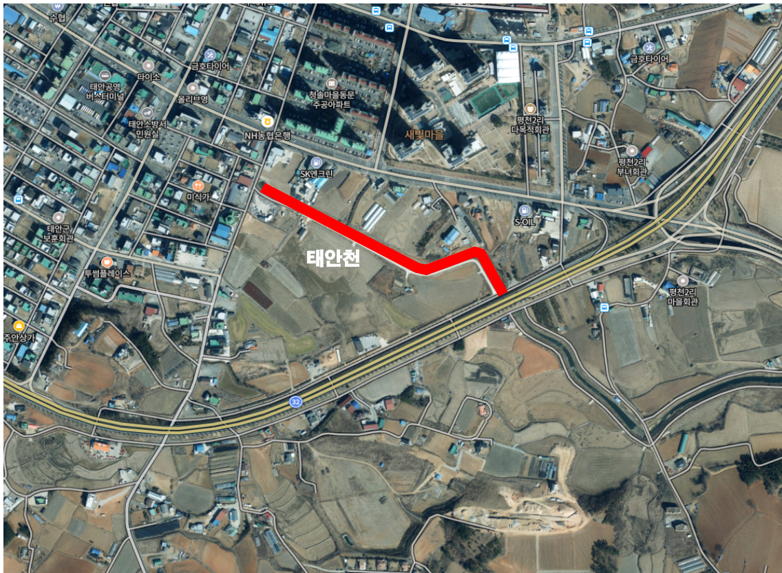
[그림 1] 태안천 주변 위성사진