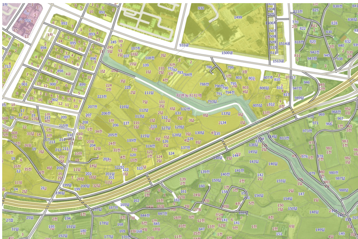
[그림 2] 도시계획 용도지역 지정현황